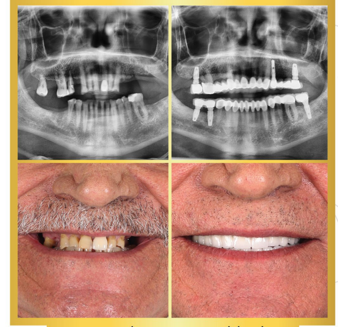
DENTAL AND İMLANT REHABILİTATION...

DENTA NORA AĞIZ VE DİŞ SAĞLIĞI POLİKLİNİĞİ "Hayalimizdeki Gülümseme"